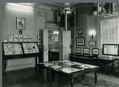
Wnętra muzealne, lata 70. XX w.