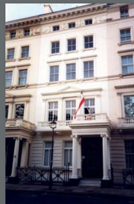
Siedziba IPMS od 1946 r. 20 Prince's Gate, Londyn

Pod koniec II wojny światowej, po konferencji jałtańskiej cofnięcie uznania dla legalnych władz RP czasowo rezydujących w Londynie stało się kwestią czasu. Sytuacja polityczna na arenie międzynarodowej zamknęła drogę powrotu do kraju wielu żołnierzom walczącym w Polskich Siłach Zbrojnych (PSZ). Obok różnorodnych podejmowanych w owym czasie inicjatyw zaistniała potrzeba stworzenia niezależnej instytucji, która byłaby w stanie przejąć zbiory Służby Archiwalno-Muzealnej PSZ i której możnaby przekazać archiwa państwowe oraz wojskowe.