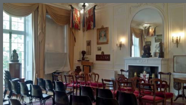
Wnętra IPMS współcześnie