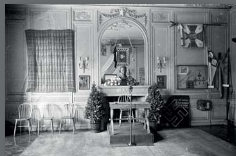
Wnętra muzealne, lata 50. XX w.